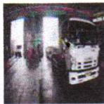
Foto Belakang Image Rear